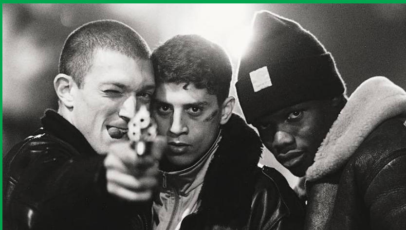
La haine © Affiche film, Mathieu Kassovitz, 1995

Lecture de L'agressivité en psychanalyse , de Jacques Lacan